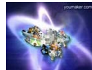
獨立評論：中共鎮壓西藏 國際抵制奧運