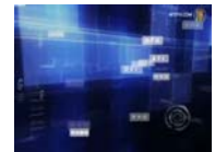
【今日點擊】PX廠崩堤 衝擊權力大壩？