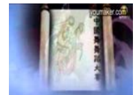
首屆新唐人全世界中國舞舞蹈大賽特輯